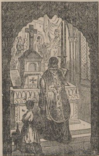
Gloria in excelsis Deo.

Consideratu nola Aingueruac Je- susen jayotzan cantatu zuen.