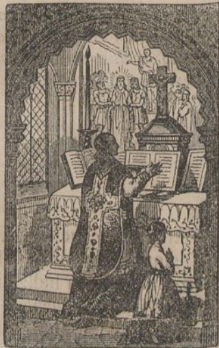
Canon ta mementoan.

Consideratu Jesu-Cristoren Pasio santuaren asiera.