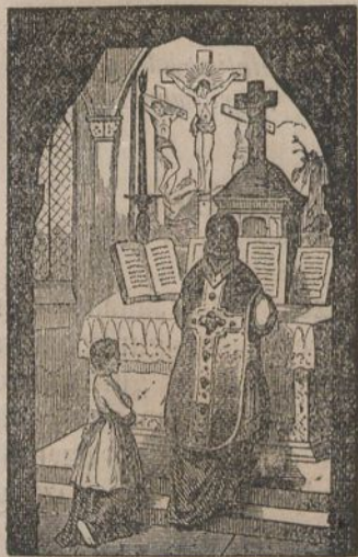
Caliza alchatu ondorean

Consideratu oraindic Jesu-Cris- toren pasioa ta bere eriotza.