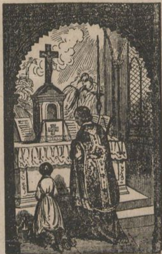
Mezaren asiera ta pecatuac aitorcea

Consideratu nola Jesu-Cristoc gure pecatuac bere gain artu, ta orien zorra pagatu zuan.