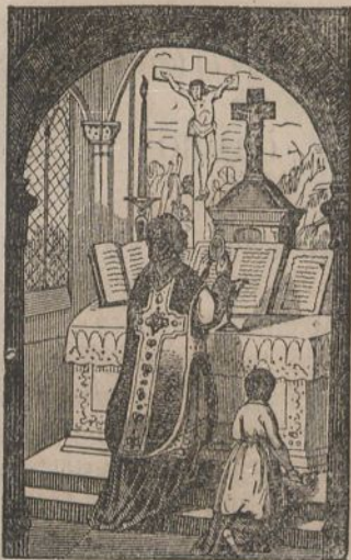
Ostia calizarequin alchatzean.

Consideratu nola Josè ta Nico- demusec Jesusen gorputza gu- rutzetic erachi zuen.