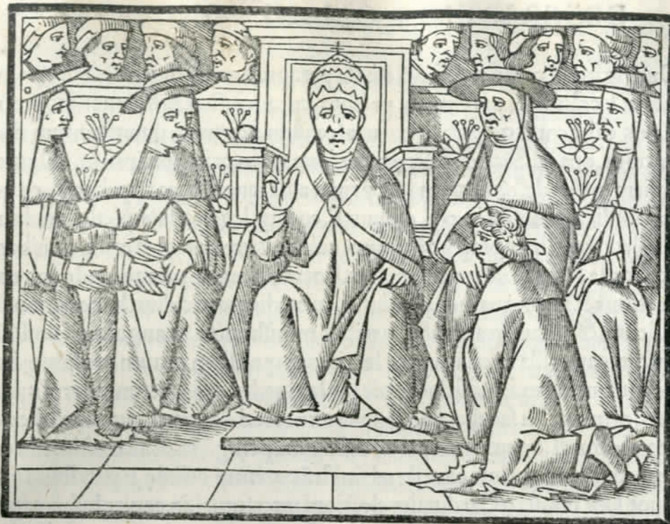
SACRARVM CERIMONIA RV M ROMANAE ECCLESIAE LIBER PRIMVS.