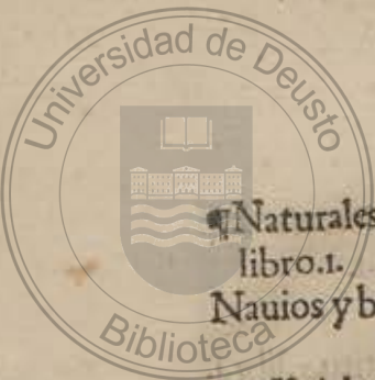
Tabla delos titulos.