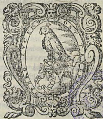
Figure ornato, & con diligenza anco ricorretto.