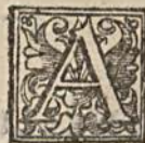
TAVOLA DELLA GIONTA.