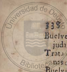
Tabla de los successos mas

Buelve su pluma à la historia judaica. ibidem.