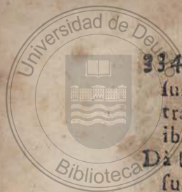
Tabla de las cosas mas memorables,

sus Reynos, en particular trata de la situacion de ella. ibidem. Da la razón porque son negros sus habitantes. fol. 15. Trata de la Religion de los Etiopes, de la grandeza de su Principe, y la Carta que escribió el dicho Principe à su Santidad, y al Rey de Portugal. fol. 19. Cap. 5. Describe la Etiopia inferior, y la divide en quatro partes. fol. 21. Trata de la primera que es el Reyno de Congo, y de sus Confines. ibidem. Describe la segunda, que es Monomotapa, y de sus confines, y trata de las Provincias que incluye en si, y de su País. fol. 22. De la tercera, que es Zanembar, y de sus Confines. ibidem. De la ultima parte llamada Ayana, y de sus Reynos, y cosas particulares de sus Reyes. ibidem. Trata vniversalmente de esta Etiopia, y cosas mas notables de ella. fol. 23.