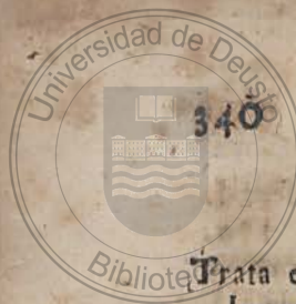
Tabla de los sucesos mas